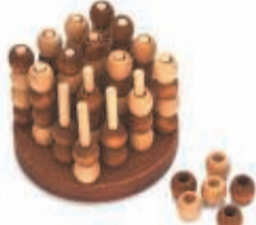
3D VIER OP EEN RIJ 6 JULI