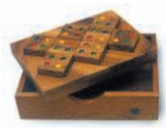
DE MOZAIEK 21 SEPTEMBER