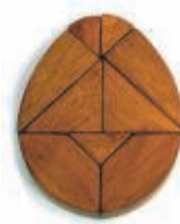
HET EI 7 SEPTEMBER