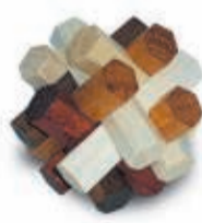
DE ZESHOEK 13 JULI