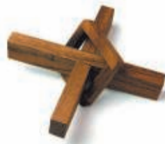
HET KRUIS 17 AUGUSTUS