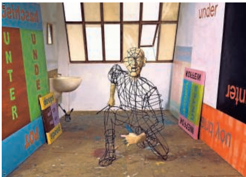
● Spiderman Atelier van Martin Kippenberger.