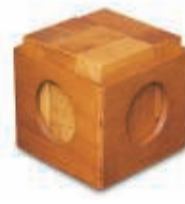
DE MAGISCHE KU 3 AUGUSTUS