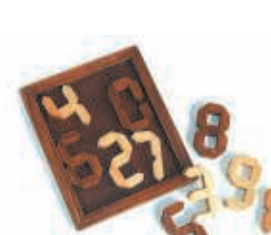
DE CIJFERPUZZEL 2 NOVEMBER