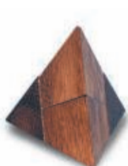
DE PIRAMIDE 19 OKTOBER