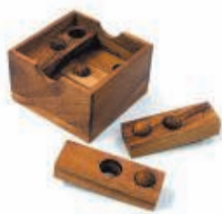
BALLEN EN GATEN 28 SEPTEMBER