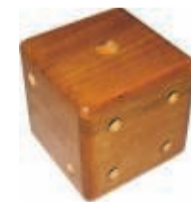
DE TEERLING 14 SEPTEMBER