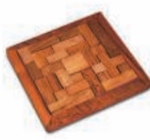
HET TANGRAM 29 JUNI