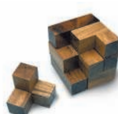
DE KUBUS 26 OKTOBER