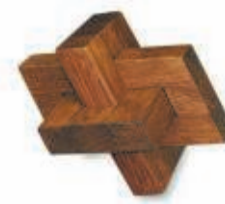
DE SCHUINE KNOOP 27 JULI