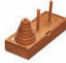
DE DE TOREN VAN HANOI 20 JULI