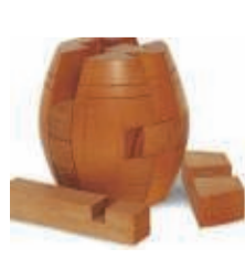
DE TON 5 OKTOBER