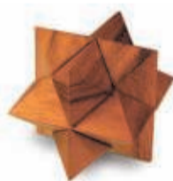
DE KOMEEET 22 JUNI