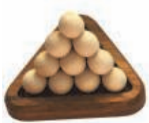
DE BALLENPYRAMIDE 10 AUGUSTUS

As if it Could. Ouverture van 20 juni tot 26 oktober in Herbert Foundation, Coupure Links 627 A, Gent. Rondleidingen op vrijdag en zaterdag. Reserveren noodzakelijk. www.herbertfoundation.org