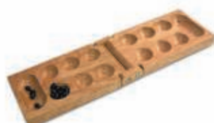
MANCALA 24 AUGUSTUS