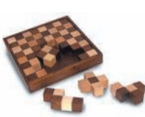
HET SCHAAKBORD 12 OKTOBER