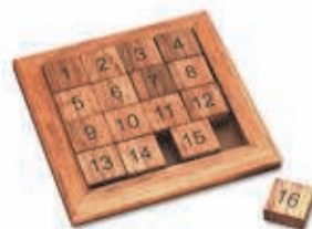
HET CIJFERBORD 31 AUGUSTUS