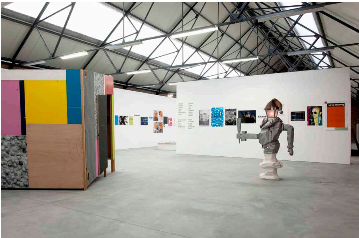
Image 3: Vue de l'exposition Distance Extended / 1979–1997. Part II avec des oeuvres et documents de Martin Kippenberger et Heimo Zobernig