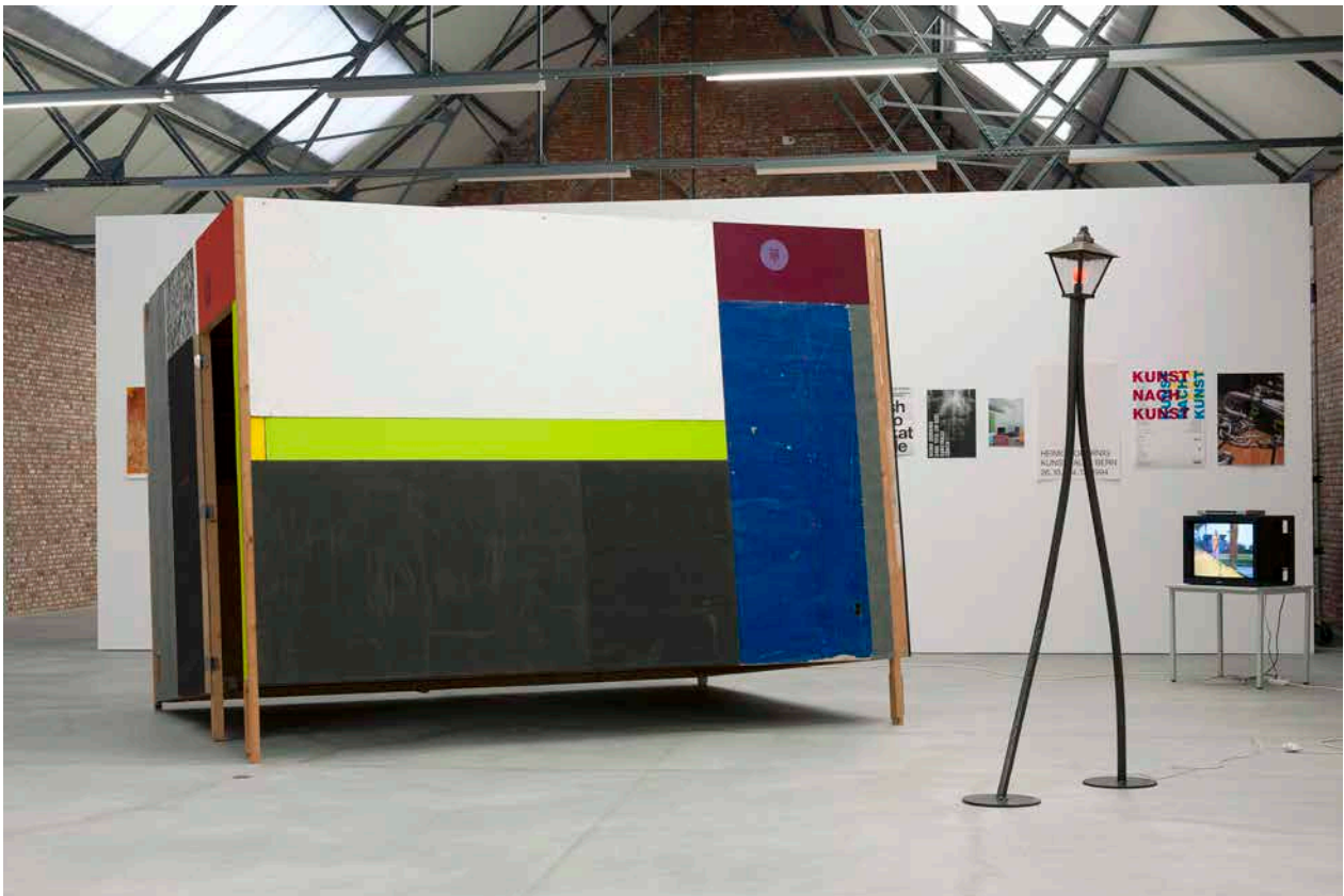
Image 4: Vue de l'exposition Distance Extended / 1979–1997. Part II avec des oeuvres et documents de Martin Kippenberger and Heimo Zobernig