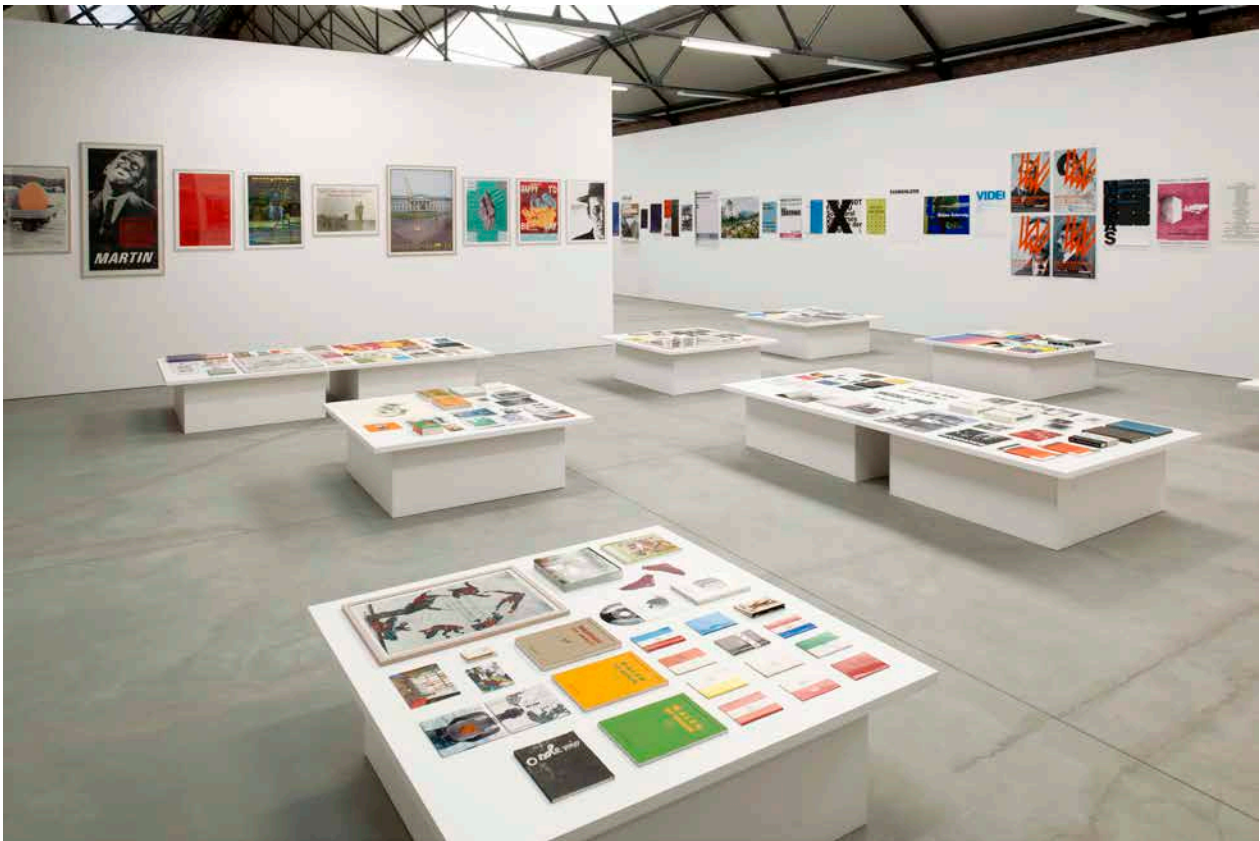
Image 2: Vue de l'exposition Distance Extended / 1979–1997. Part II avec des documents de Martin Kippenberger et Heimo Zobernig