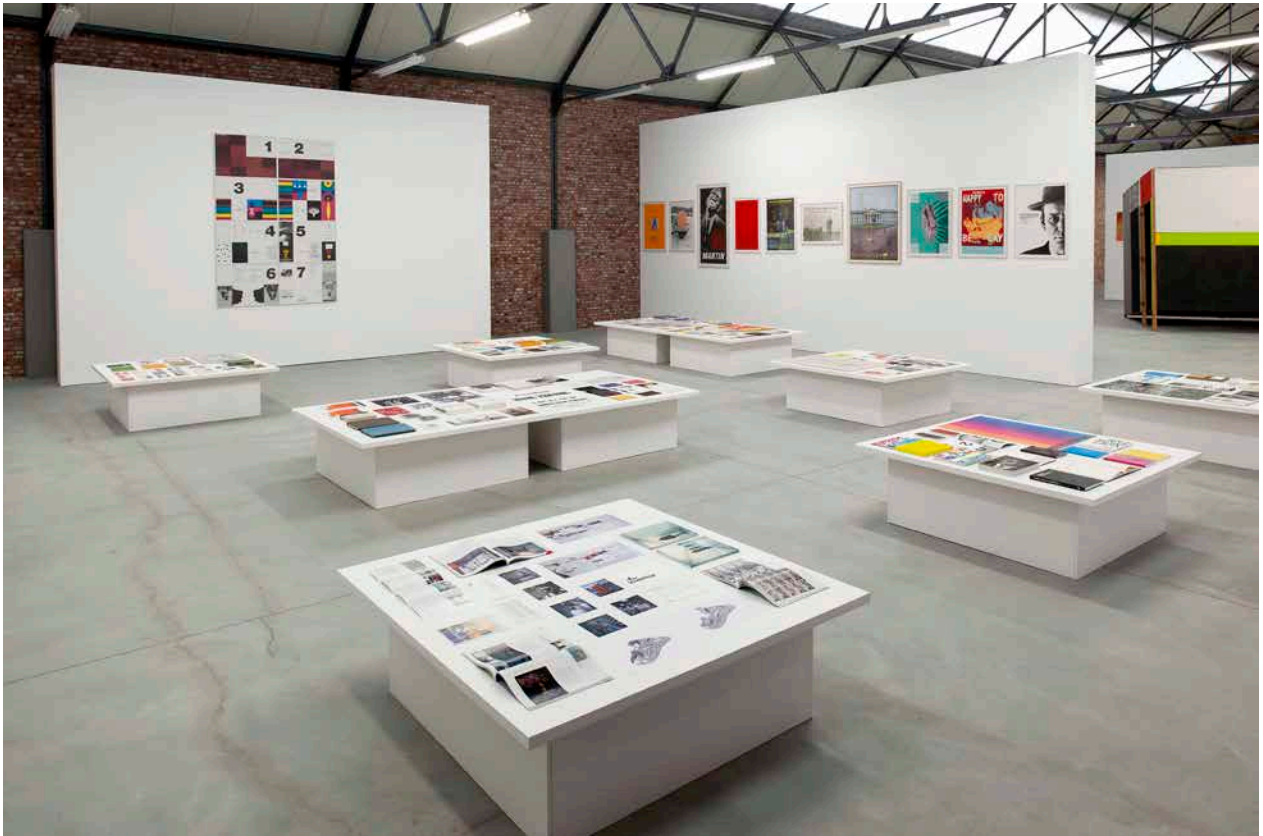
Image 1 : Vue de l'exposition Distance Extended / 1979–1997. Part II avec des oeuvres et documents de Martin Kippenberger et Heimo Zobernig

Veillez bien mentionner la numérotation des photos souhaitées.