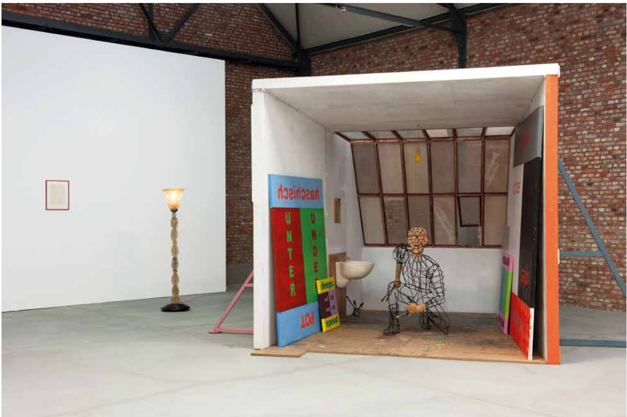
Image 5: Vue de l'exposition Distance Extended / 1979–1997. Part II avec des oeuvres de Martin Kippenberger