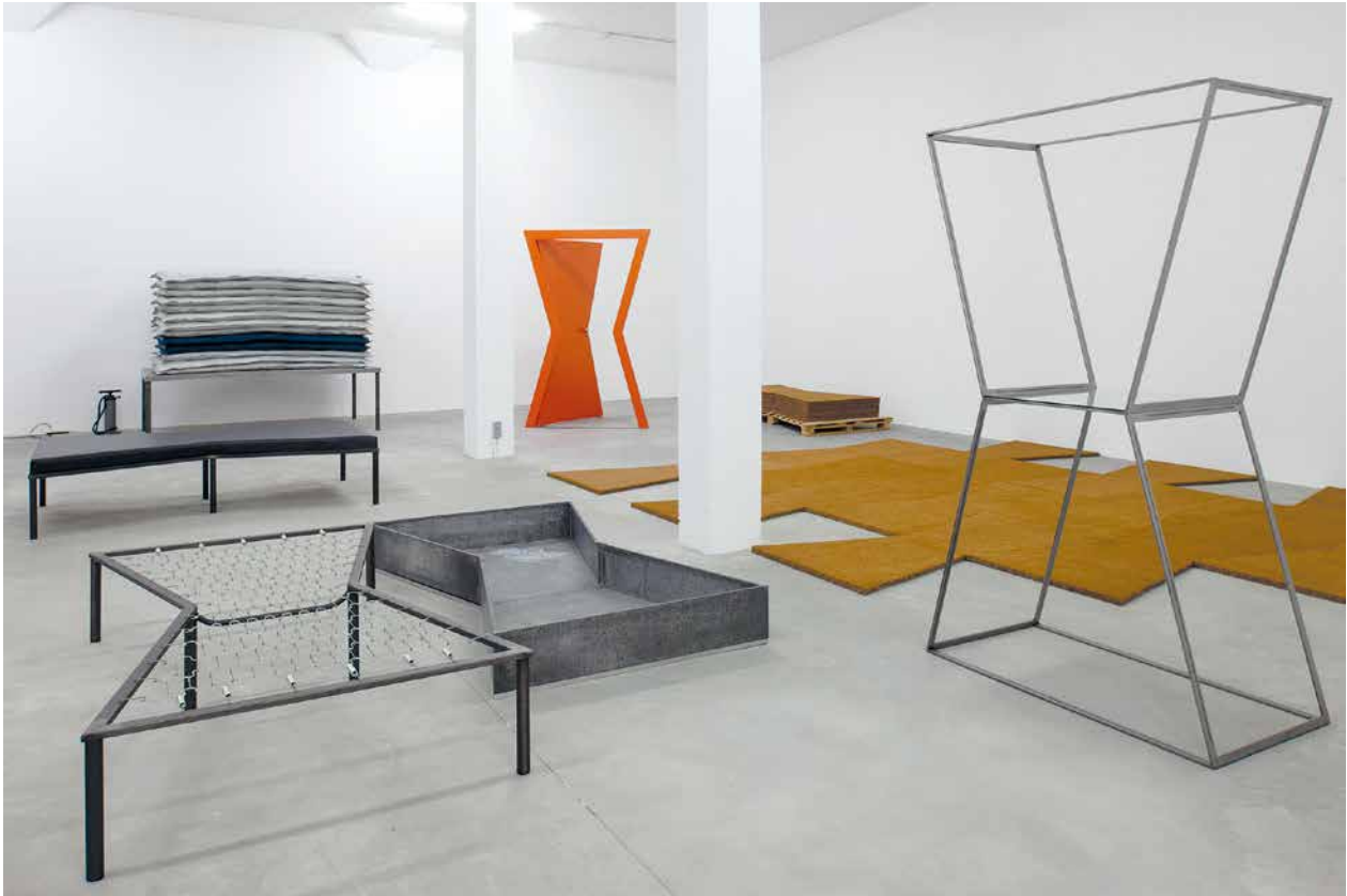
Image 6 : Vue de l'exposition Distance Extended / 1979–1997. Part II avec des oeuvres de Michelangelo Pistoletto