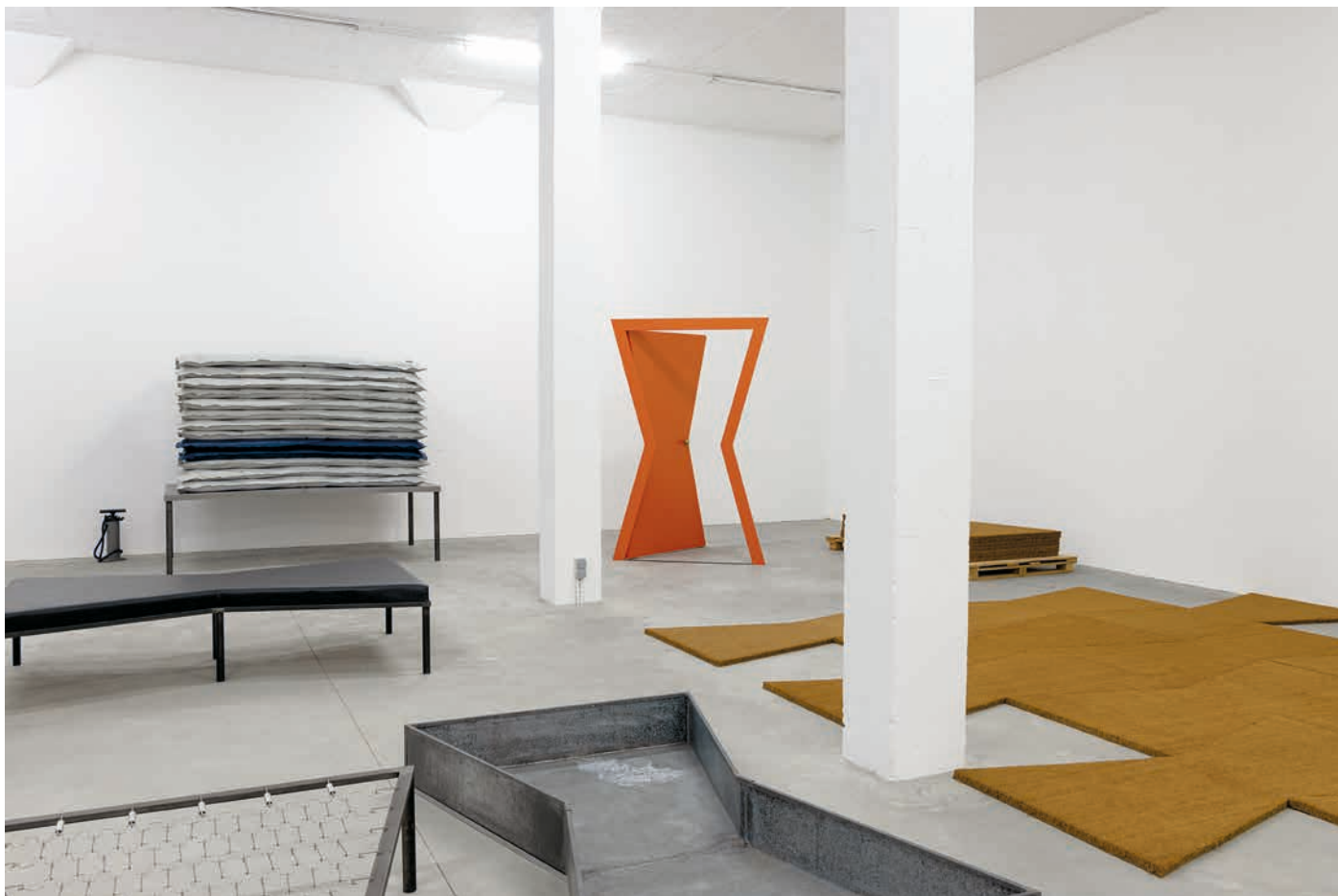
Michelangelo Pistoletto, Segno Arte - Unlimited , 1976–2008 (Herbert Foundation, 2021). Foto door Yuri van der Hoeven © Michelangelo Pistoletto

Distance Extended / 1979–1997 Works and Documents from Herbert Foundation. Part II