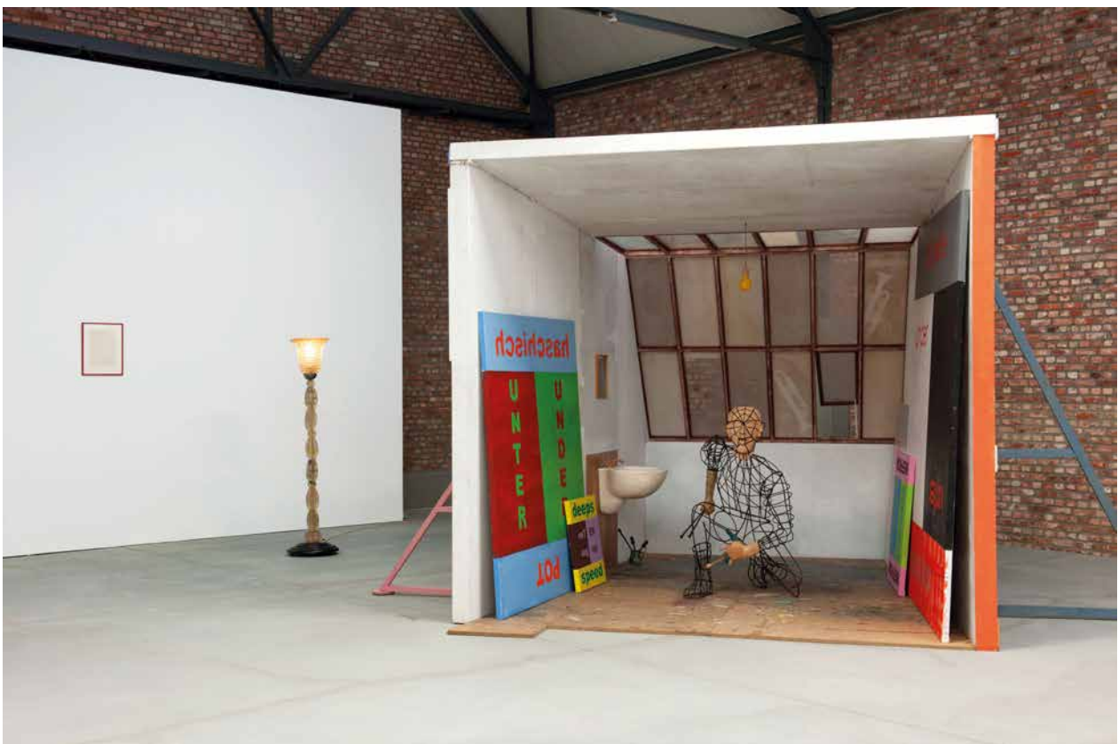
Afbeelding 5: Tentoonstellingszicht Distance Extended / 1979–1997. Part II met werk van Martin Kippenberger